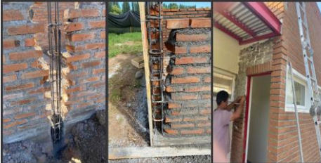
ENFIERRADURAS SOLDADAS ENBENTADO MAL EJECUTADO ENCHAPE DESNIVELADO