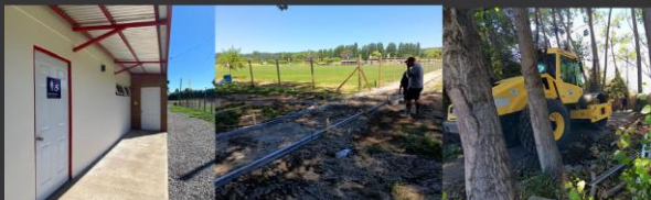
REFUERZO MARQUESINA EXTENSIÓN DE RUTA ACCESIBLE CONSTRUCCIÓN DE PUENTE